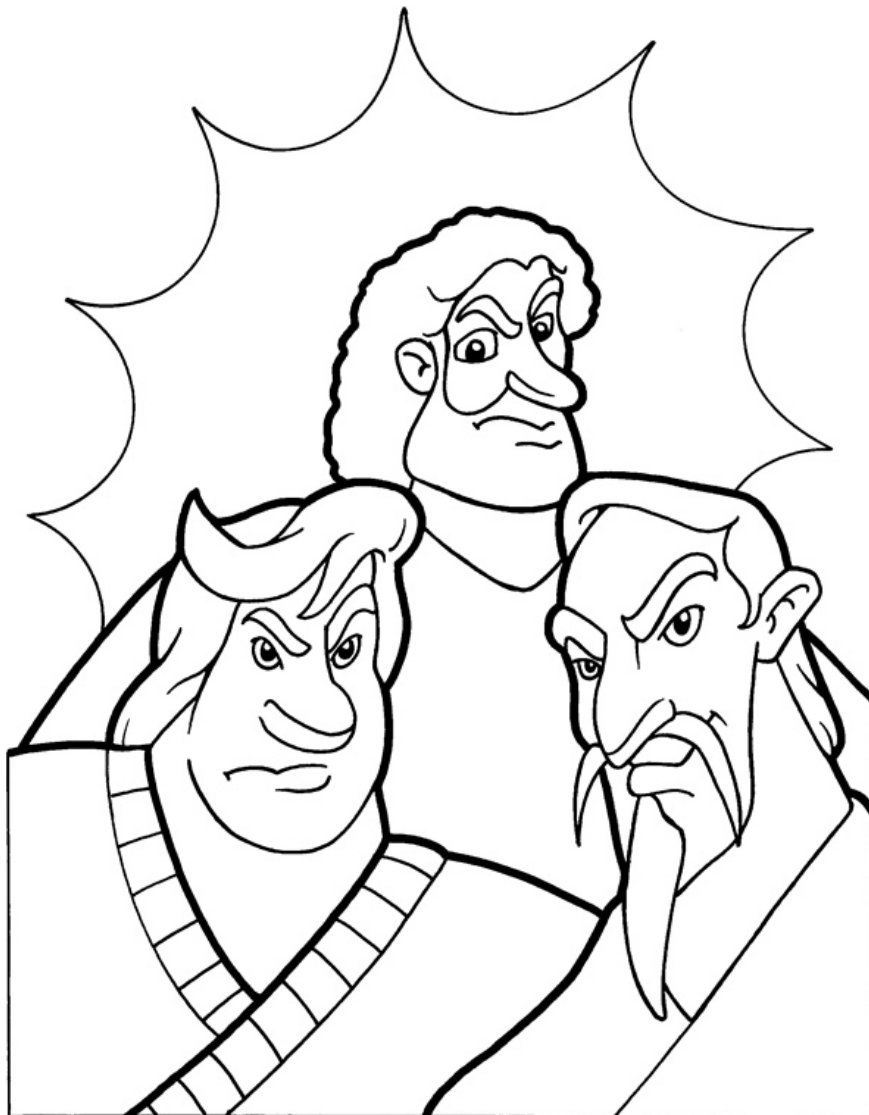
Parabola de los labradores malvados Mateo 21:33-45