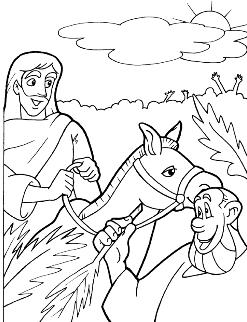
LA ENTRADA TRIUNFAL