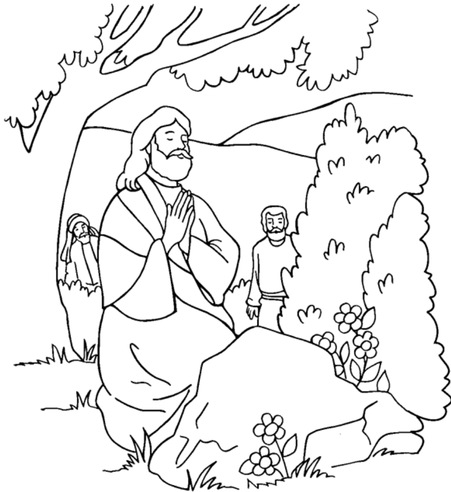
Jesús ora por sus discípulos Juan 17:6-19