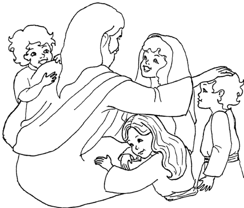
Jesús y los niños

"Cualquiera que hace la voluntad de Dios es mi hermano, mi hermana y mi madre."