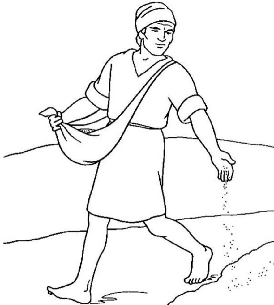
La parábola de la semilla que crece Marcos 4:26-29

Cada número representa una letra del alfabeto. Sustituye cada letra por el número correspondiente para resolver las palabras secretas.