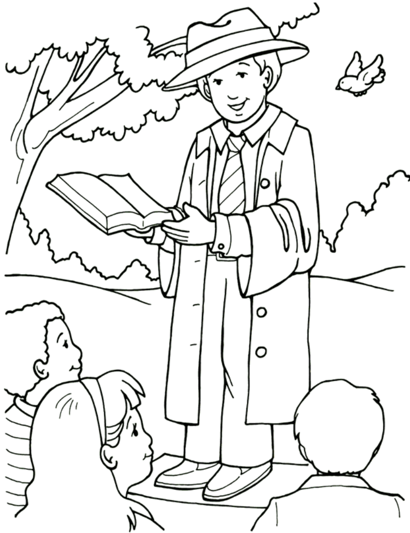
Predicando las buenas nuevas del reino.

From Thru-the-Bible Coloring Pages for Ages 4-8. © Standard Publishing. Used by permission. Reproducible Coloring Books may be purchased from Standard Publishing, www.standardpub.com , 1-800-543-1301.