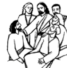
Después llamó a los doce, y comenzó a enviarlos de dos en dos. Marcos 6:7