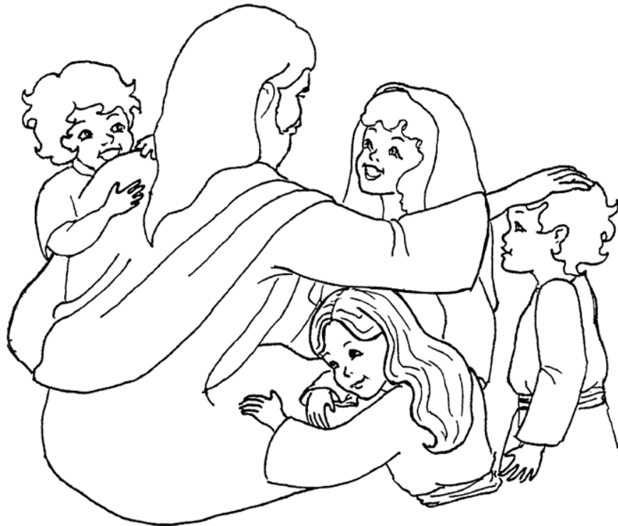
Jesús y los niños