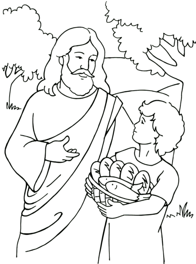
Jesús alimenta a los cinco mil

From Thru-the-Bible Coloring Pages for Ages 4-8. © 1986, 1988 Standard Publishing. Used by permission. Reproducible Coloring Books may be purchased from Standard Publishing, www.standardpub.com, 1-800-543-1301