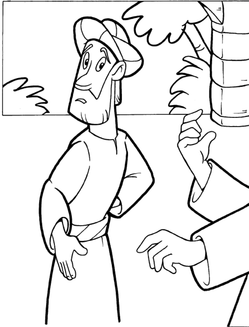
EL JOVEN RICO