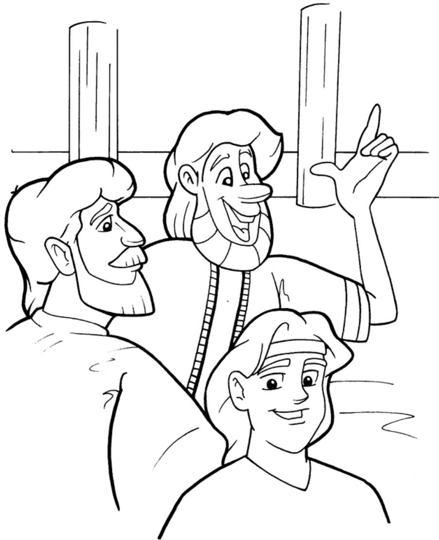
El niño Jesús en el templo Lucas 2:41-52