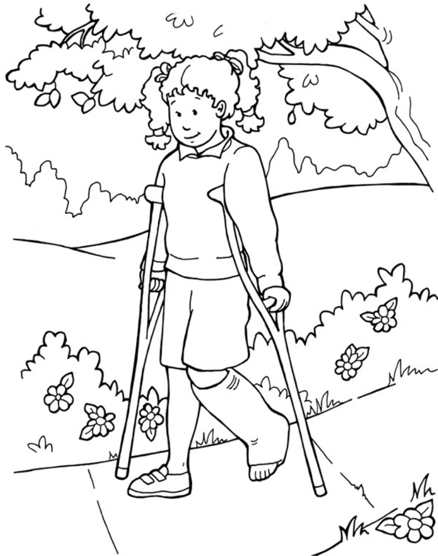
Jesús puede sanar