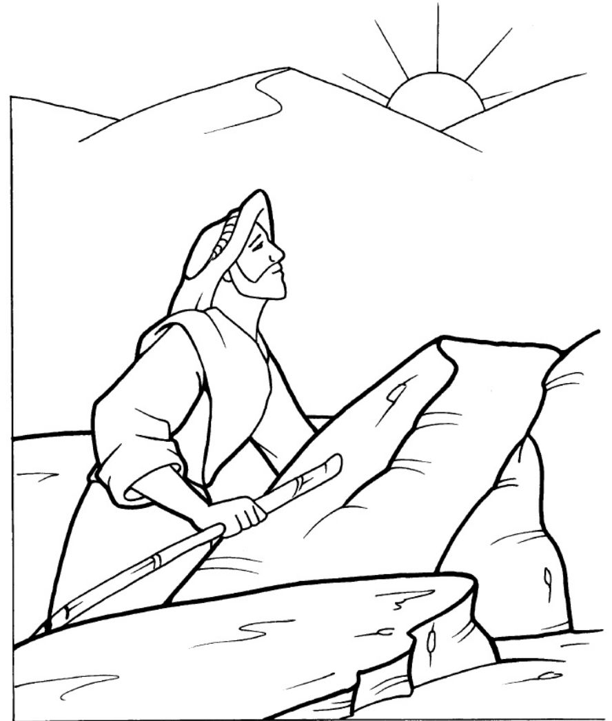
Tentación de Jesús