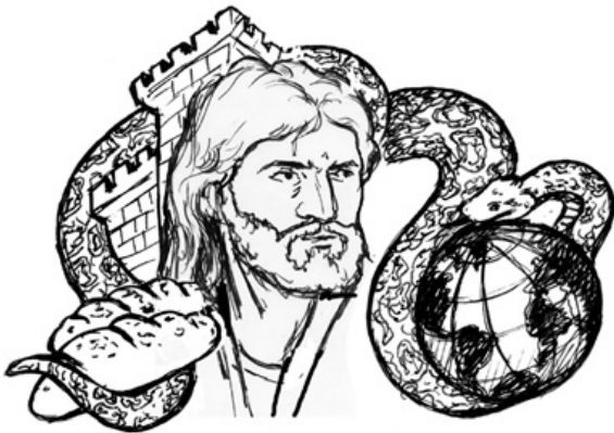
Tentación de Jesús