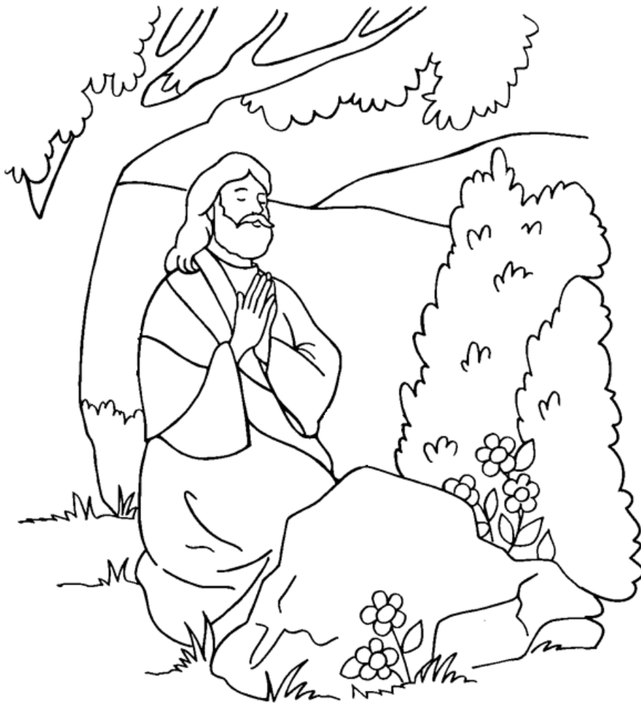
Jesús ora por todos los creyentes

From Thru-the-Bible Coloring Pages for Ages 4-8. © 1986,1988 Standard Publishing. Used by permission. Reproducible Coloring Books may be purchased from Standard Publishing, www.standardpub.com , 1-800-323-7543.