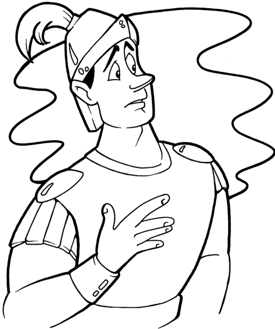
La fe del centurión