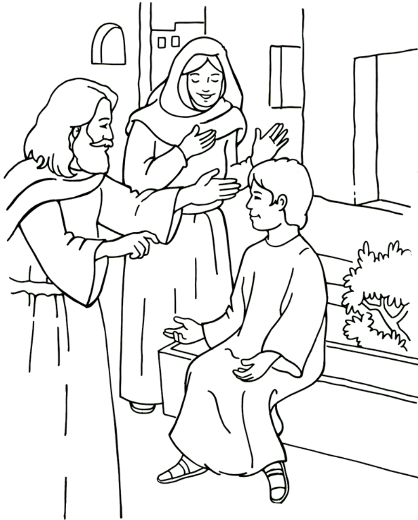
Jesús resucita al hijo de una viuda

Cada número representa una letra del alfabeto. Sustituye cada letra por el número correspondiente para resolver las palabras secretas.