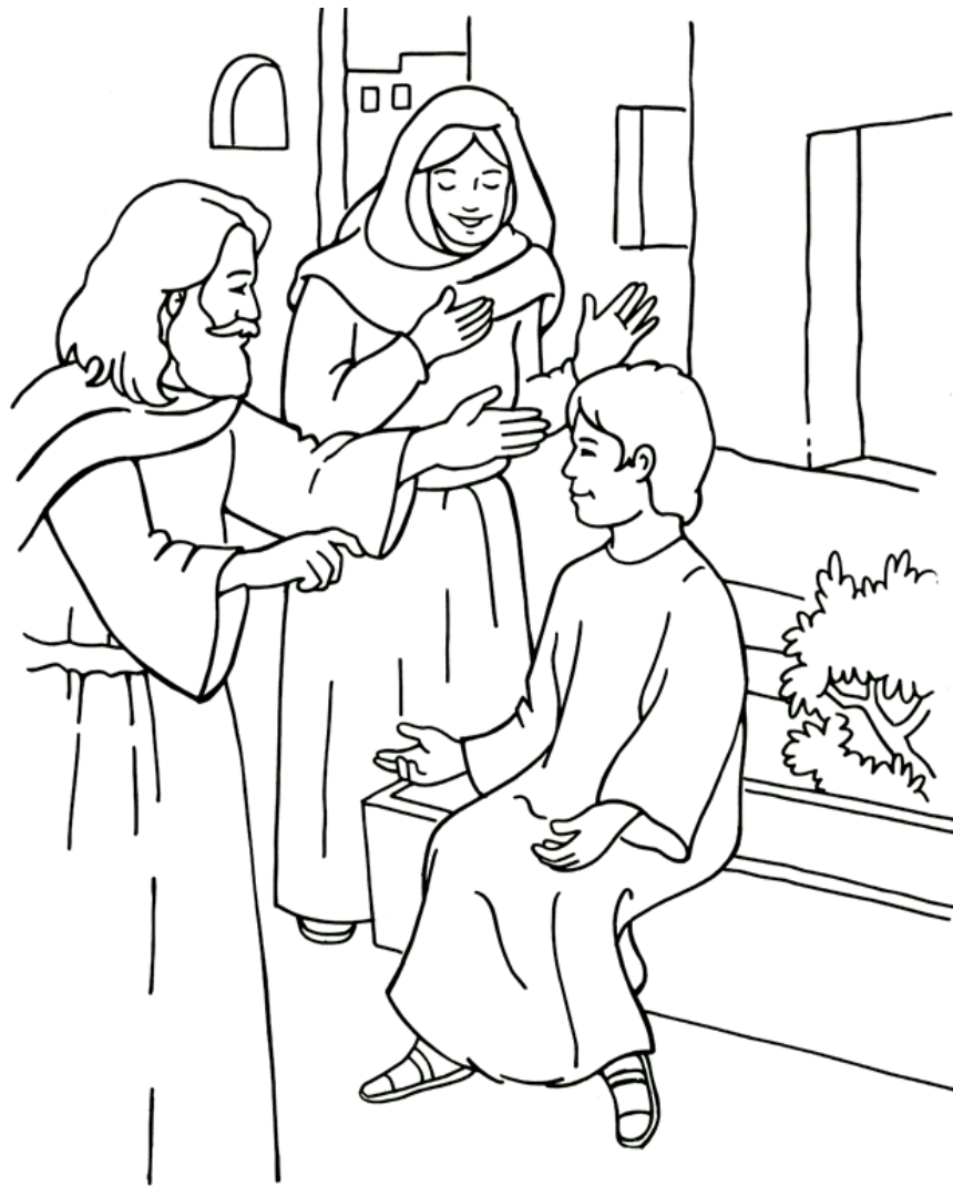
Jesús resucita al hijo de una viuda

From Thru-the-Bible Coloring Pages for Ages 4-8. © 1986,1988 Standard Publishing. Used by permission. Reproducible Coloring Books may be purchased from Standard Publishing, www.standardpub.com .