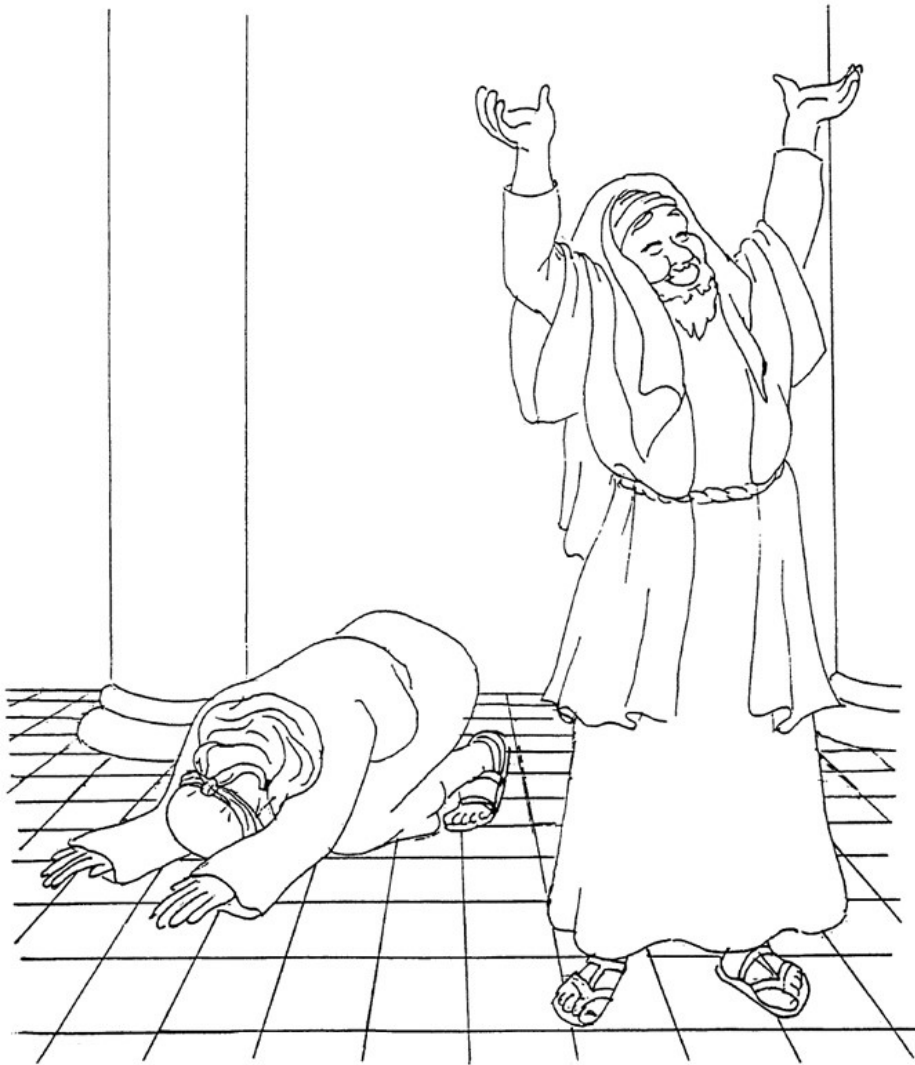
El fariseo y el recaudador de impuestos