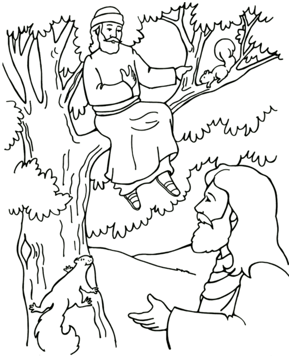
Zaqueo y Jesús Lucas 19:1-10