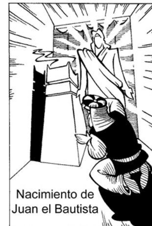
Nacimiento de Juan el Bautista