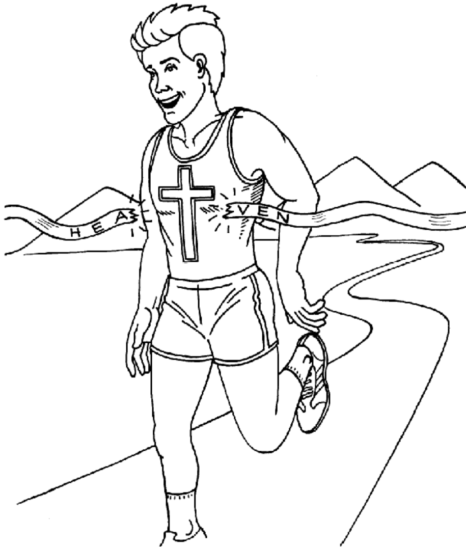
Corre la Carrer