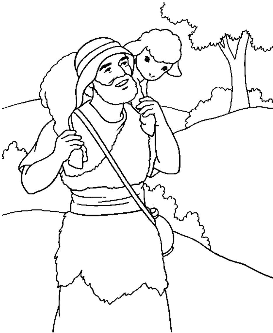
La oveja perdida