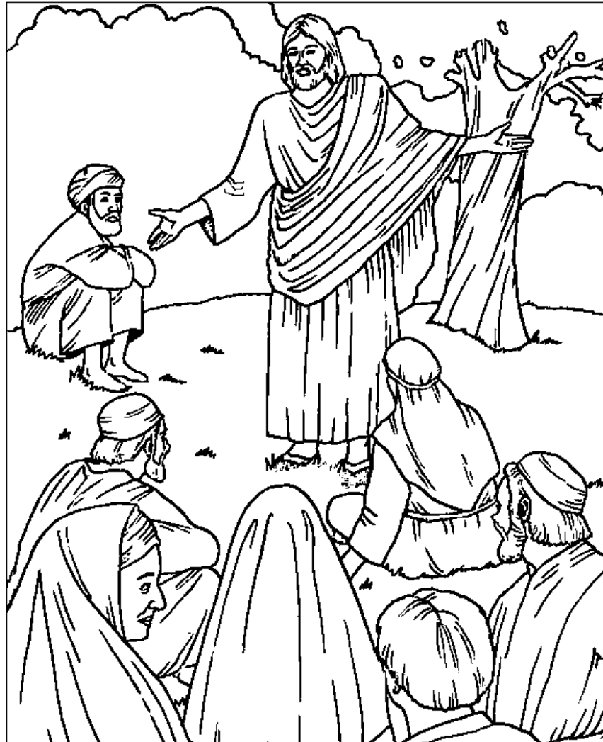
El sermón del monte

From BibleStoryCard Learning System(tm) Coloring Book © 1996 Wesleyan Publishing House. Used by permission. Additional BibleStoryCard resources are available by calling 1-800-493-7539 or visiting online http://www.wesleyan.org/wph/childrensresources/biblestorycards/biblestorycards.htm