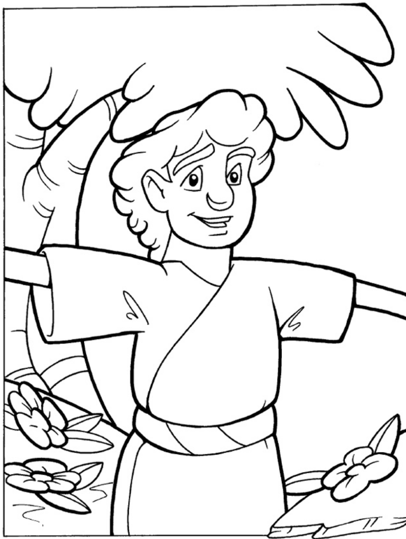
Ama a tus enemigos