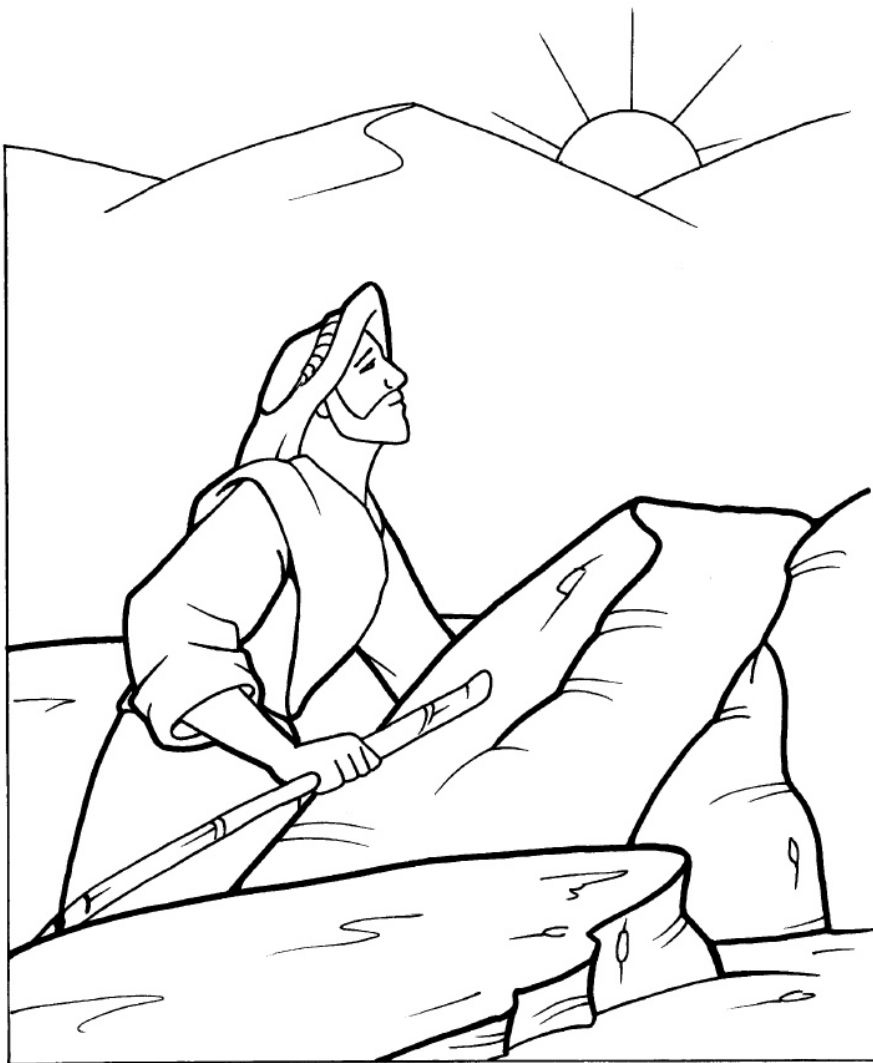
La tentación de Jesús