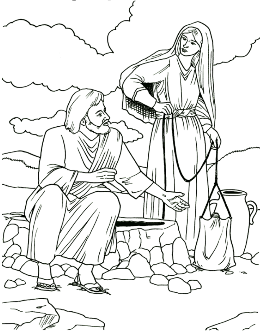
La mujer samaritana

From BibleStoryCard Learning System(tm) Coloring Book © 1996 Wesleyan Publishing House. Used by permission. Additional BibleStoryCard resources are available by calling 1-800-493-7539 or visiting online http://www.wphonline.com/product.asp?sku=2158_GMA400