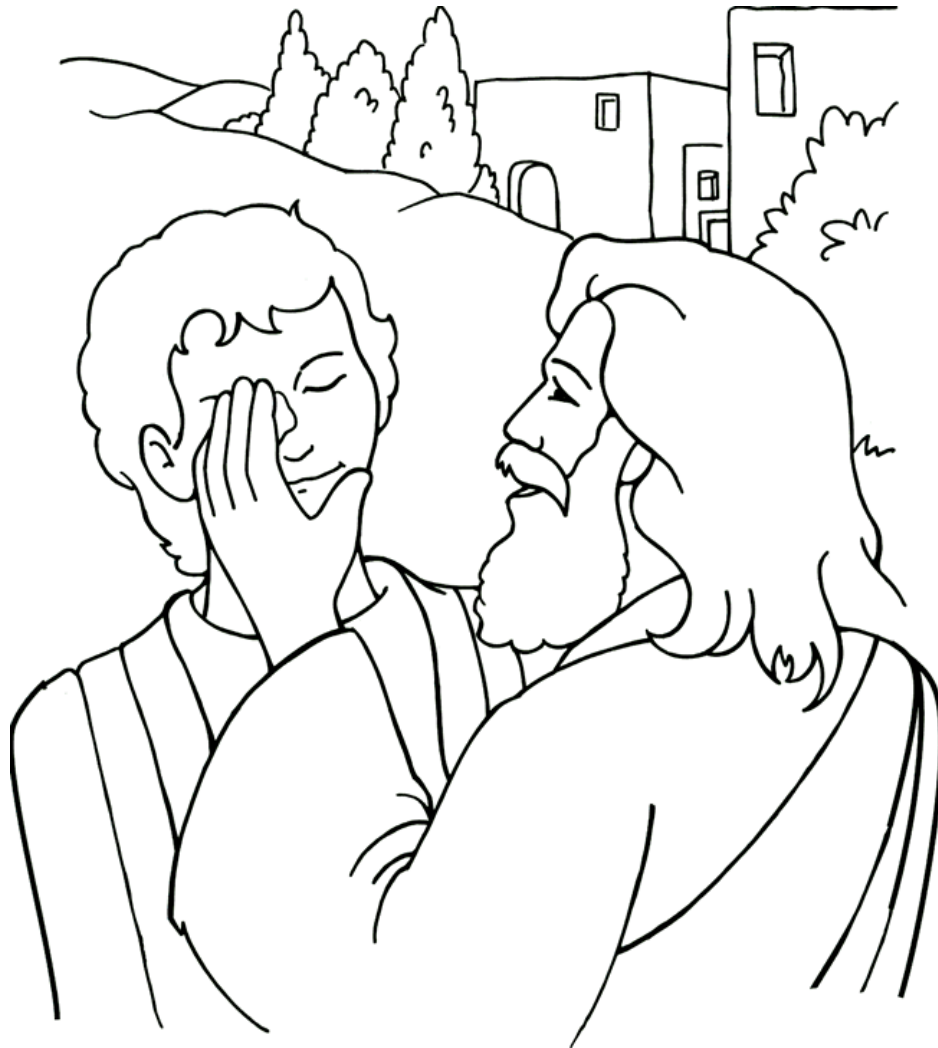
Jesús sana a un ciego Juan 9

From BibleStoryCard Learning System(tm) Coloring Book © 1996 Wesleyan Publishing House. Used by permission. Additional BibleStoryCard resources are available by calling 1-800-493-7539 or visiting online http://www.wphonline.com/product.asp?sku=2158_GMA400