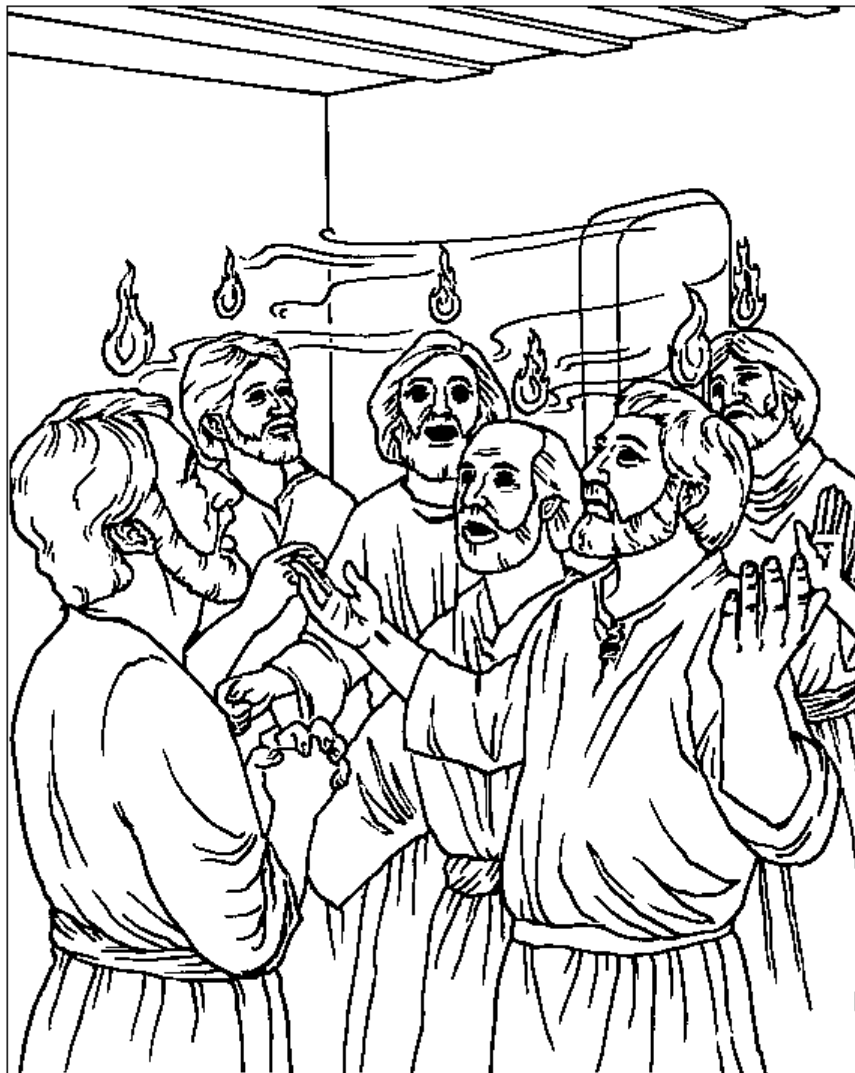
El día de Pentecostés Hechos 2

From Thru-the-Bible Coloring Pages for Ages 4-8. © 1986, 1988 Standard Publishing. Used by permission. Reproducible Coloring Books may be purchased from Standard Publishing, www.standardpub.com, 1-800-543-1301.