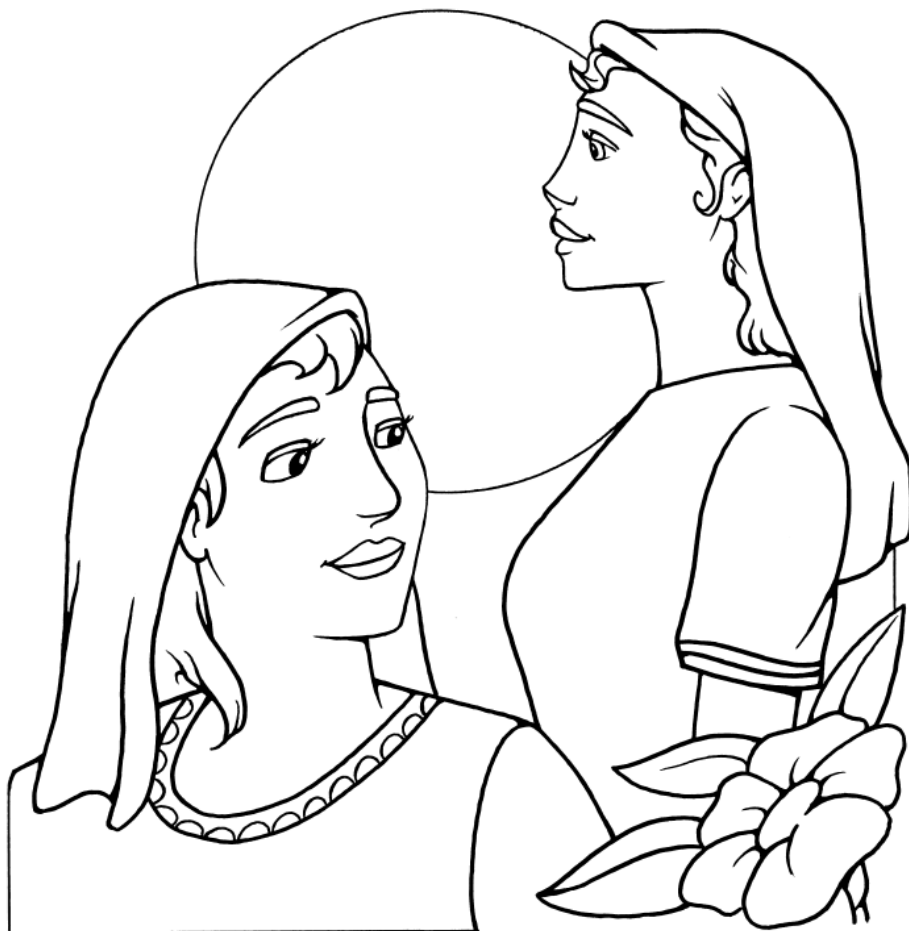
Lea y Raquel

Labán tenía dos hijas. La mayor se llamaba Lea, y la menor, Raquel. Génesis 29:16 (NVI)