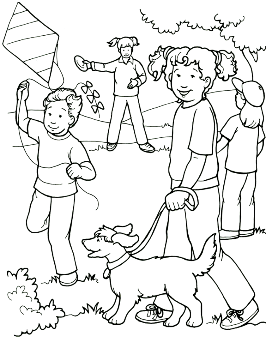
Jesús ama a todos

From Thru-the-Bible Coloring Pages for Ages 4-8. © Standard Publishing. Used by permission. Reproducible Coloring Books may be purchased from Standard Publishing, www.standardpub.com , 1-800-543-1301.