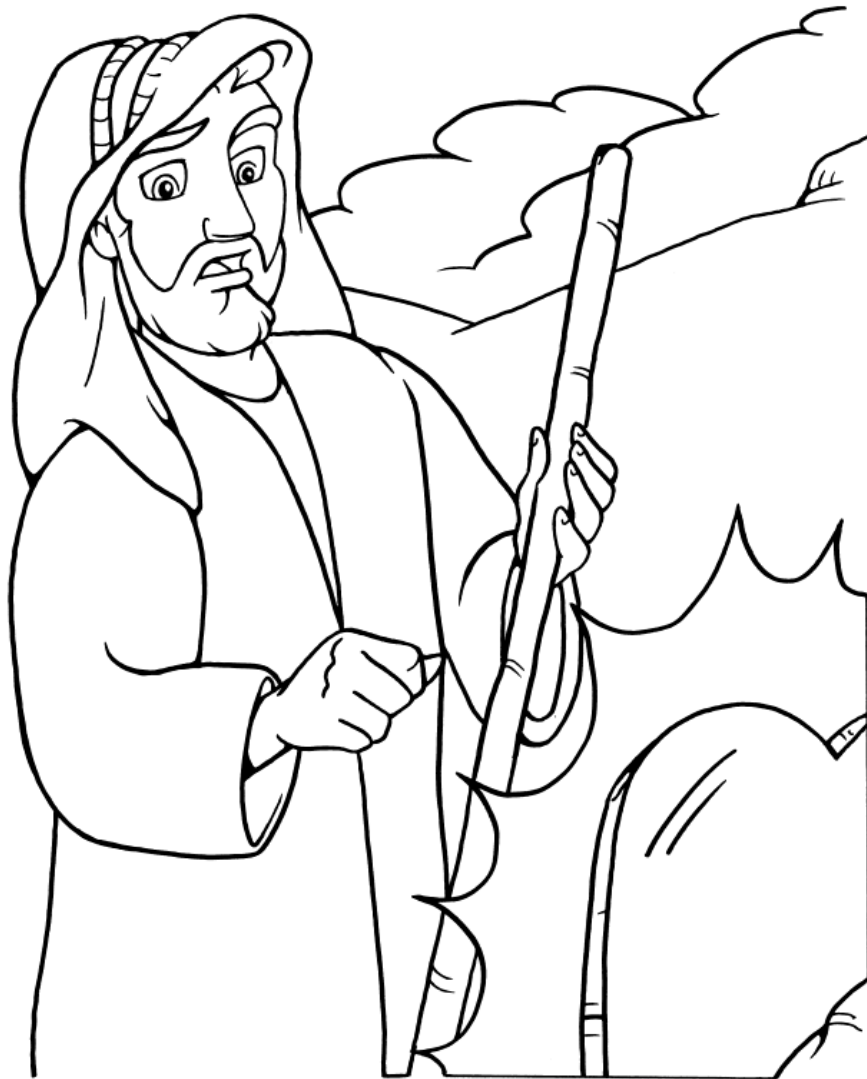
Los Diez Mandamientos Éxodo 20:1-17