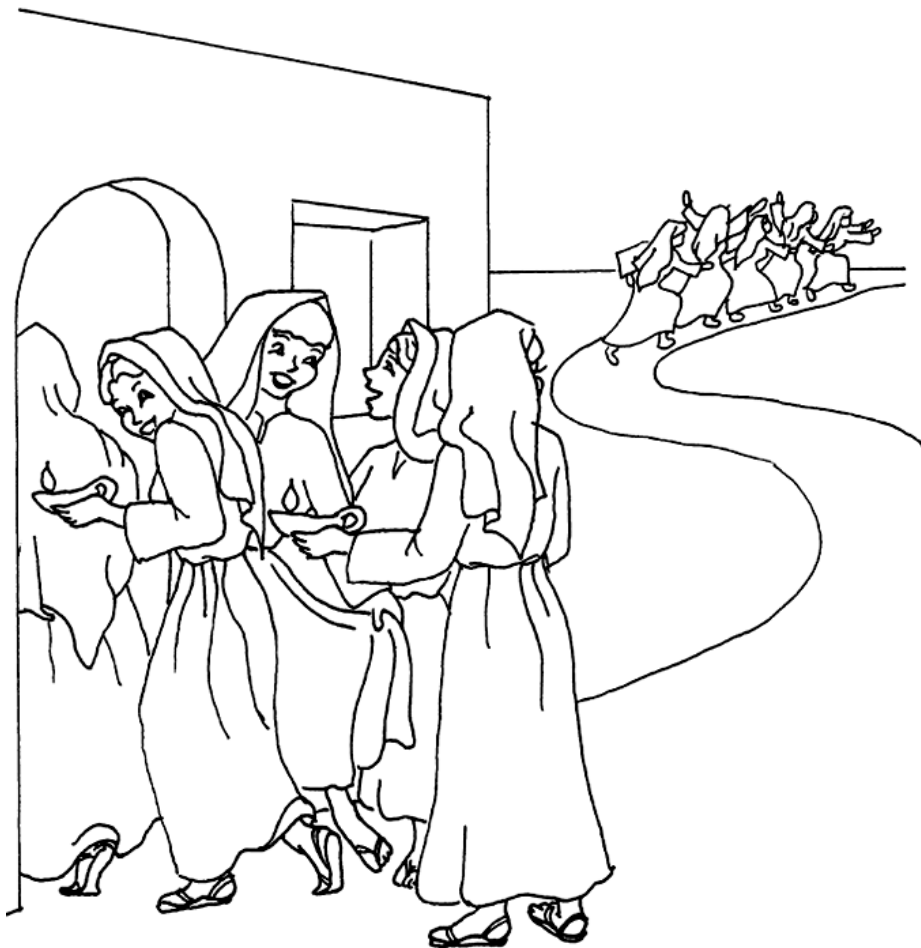
Parábola de las diez jóvenes

Copyright © CalvaryCurriculum.com Used by permission