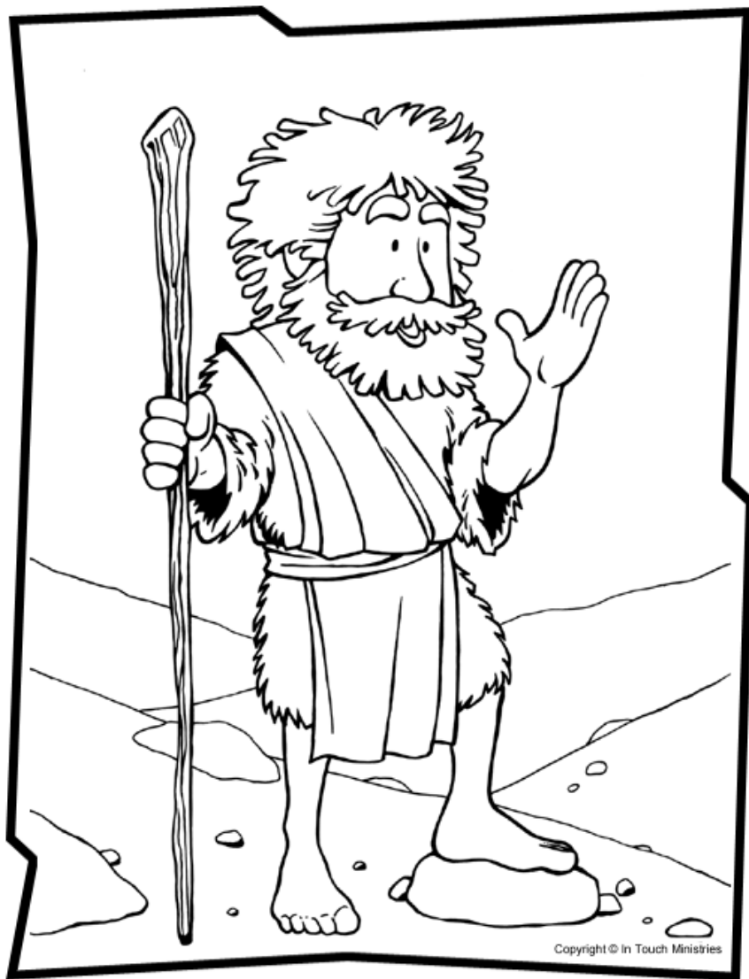
Juan el Bautista