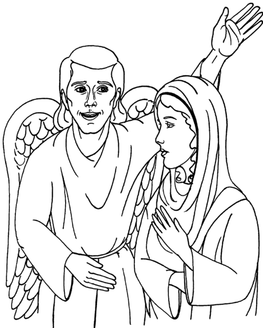
Un angel visita a María Lucas 1:26-38