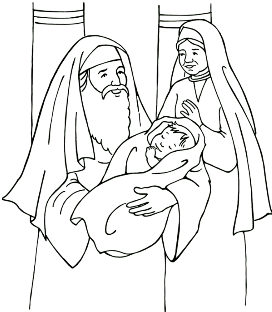
Simeón y Ana alaban a Dios Luke 2